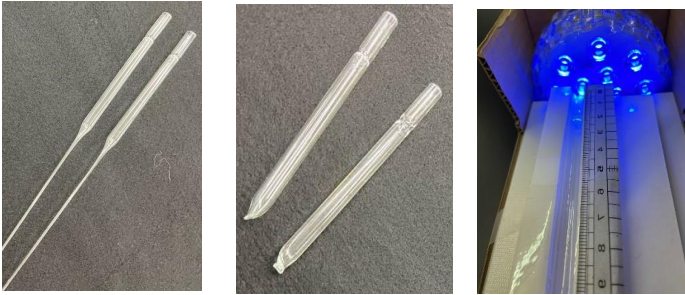
図1. パスツールピペット 図2. 先端を塞いだピペット 図3. 移動測定実験装置

今回の研究では、国立環境研究所から分譲されたミカヅキモ (NIES-124) Closterium acerosum を用いて実験を行った。また、パスツールピペットを用いて観察用の試験管を作り、発泡スチロールと空き箱で作った移動測定実験装置を作成した。(図1~3)